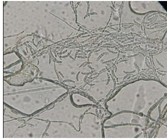
c. Perbesaran 400X

Gambar 2. Kenampakan gejala infeksi Fusarium pada daun tanaman padi, biakan murni patogen pada umur 7HSI dan mikrokonidia patogen.